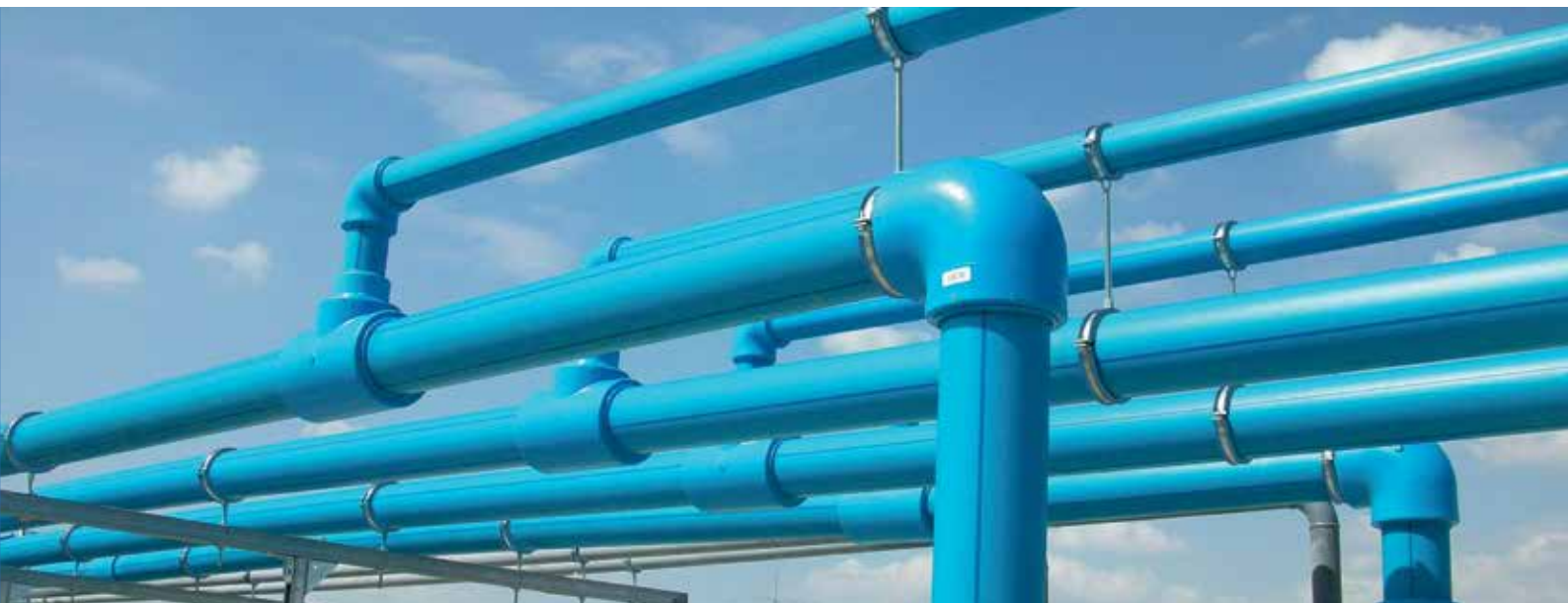
Fotografía realizada previamente a la colocación de aislamiento.