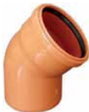
Codo Macho/Hembra 45° con junta. Color teja