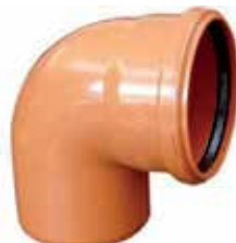
Codo Macho/Hembra 87° con junta. Color teja